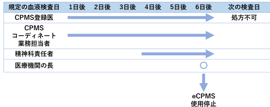
69 13.2 血糖モニタリングの不遵守への対応

CPMS センターは、規定の検査間隔以内に血糖検査結果が医療機関より報告されなかった場合、以下の対応をします。